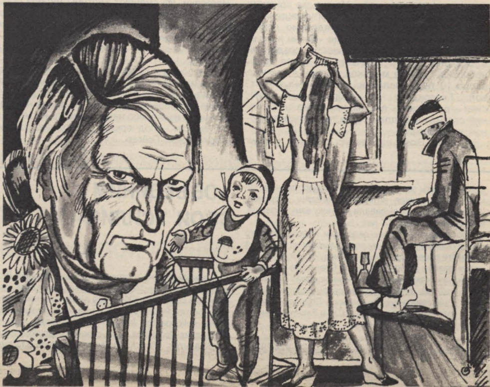
Рисунок М. Петрова

— А зачем ему врать? Какая ему выгода? — запальчиво спросил парнишка, рассказывавший про Одиссея. — Все они тут... Врачам несут коньяк, медсестрам конфеты.