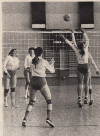
«Мяч в игре!» Женская волейбольная команда завода бытовых кондиционеров играет в первой лиге.