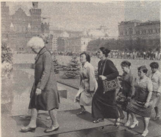
Участницы семинара посетили Мавзолей В. И. Ленина.

За создание для женщин хороших условий труда и быта заводу пластмассовых изделий присуждено первое место в отрасли. Забота о рабочем человеке оборачивается большой пользой и для предприятия. Текущесть кадров на заводе — 9 процентов, здесь более ста трудовых династий.