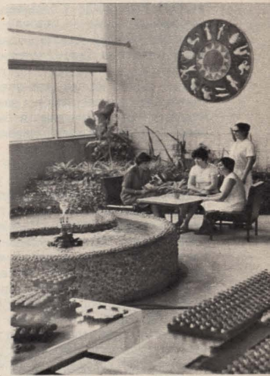
Есть где отдохнуть во время обеденного перерыва работницам компрессорного цеха.