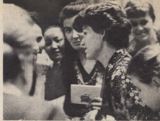
В один из дней состоялась встреча с В. В. Терешковой, председателем Комитета советских женщин.

Сами женщины стараются заслужить право на такой красный пропуск. Вручается он в торжественной обстановке как поощрение за хорошую работу по решению совета бригады. Пока красные пропуска — лишь на заготовительных участках.