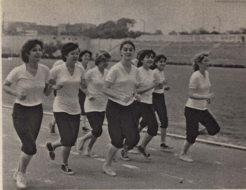
На стадионе «Спартак» идут занятия в «группе здоровья» фабрики спортивных товаров.