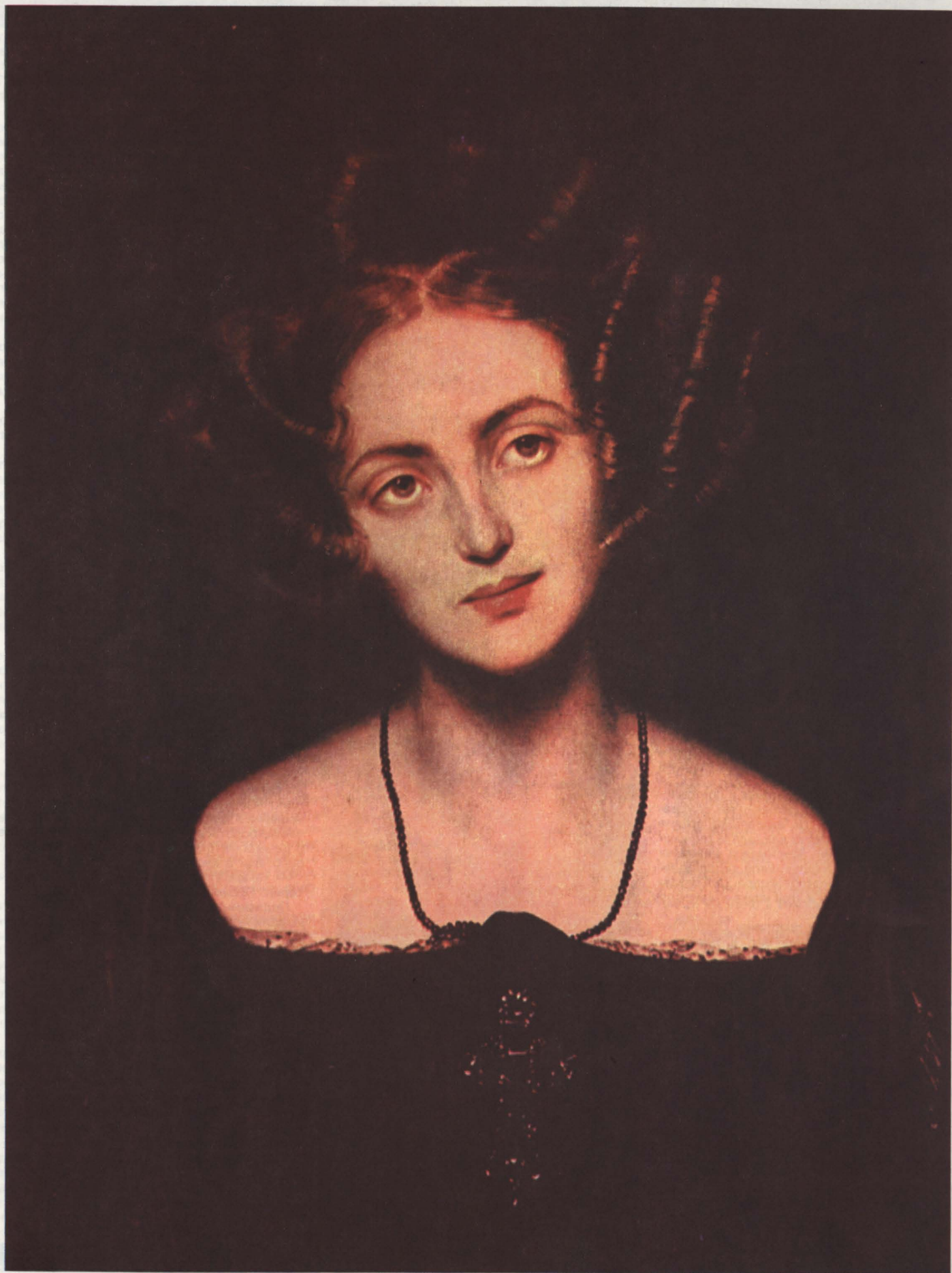
П. ДЕЛАРОШ. ПОРТРЕТ ГЕНРИЕТТЫ ЗОНТАГ.

1 2 3 4 5 6 7 8 9 10 11 12 13 14 15 16 17 18 19 20 21 22 23 24 25 26 27 28 29 30