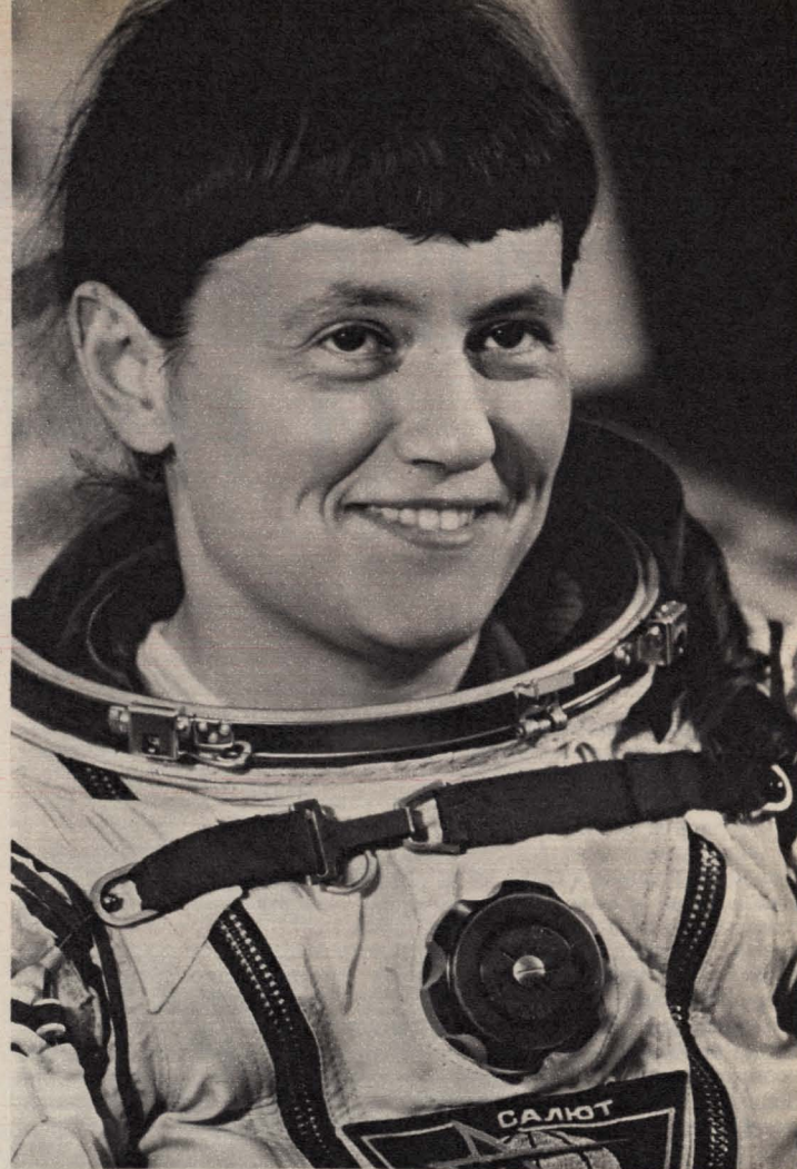
Светлана Евгеньевна Савицкая.

С трибуны съезда товарищ Л. И. Брежнев говорил: «Наш народ знает: все, что он имеет, создано его собственным трудом, защищено его собственной кровью». Трудом народа, каждого из нас сильна наша любимая Советская страна, у которой сегодня прекрасный праздник — день ее рождения.