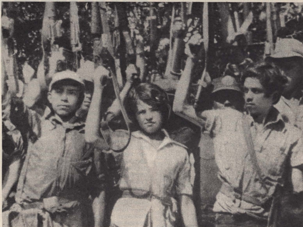
В одном из отрядов Фронта национального освобождения имени Фарабундо Марти.

Присутствовала на этой встрече и делегация Комитета советских женщин. Она передала руководству патриотических сил Сальвадора в дар от советских женщин медикаменты и детскую одежду.