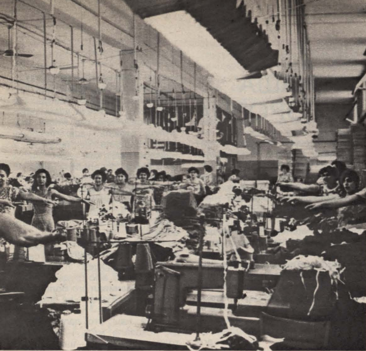
начиная физкультурную паузу в швейном цехе.