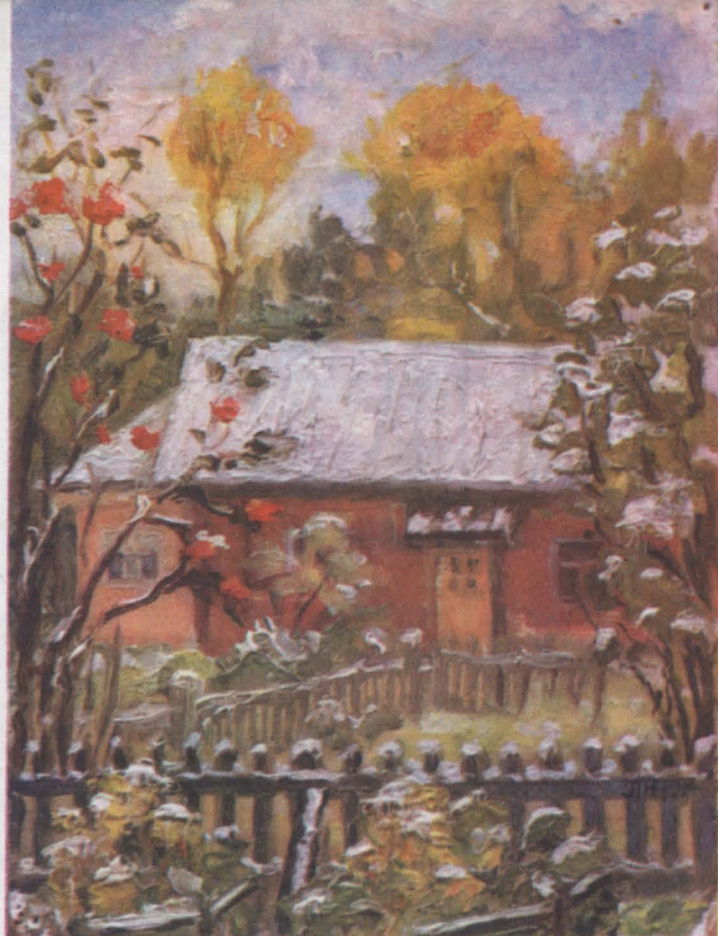
Снег в сентябре.

При знакомстве с Лидией Ивановной первое, что я услышала от нее, были слова: