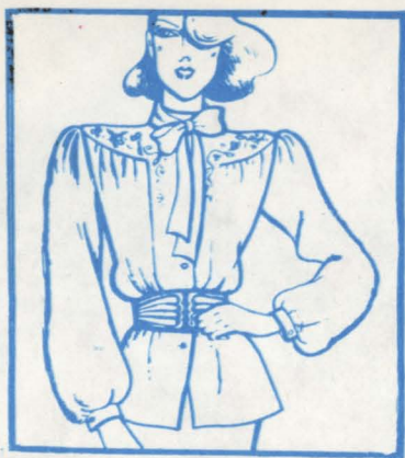
Моды Рижского Дома моделей.