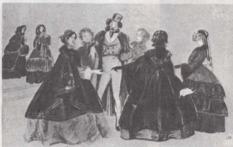
Эскиз к кинокартине «Дядюшкин сон».

«Я плакатист» — и говорит: «Я художник».